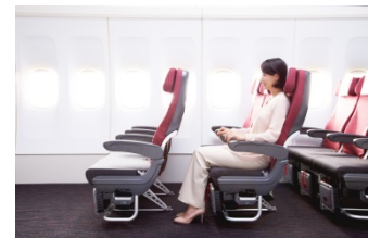
JAL SKY WIDER