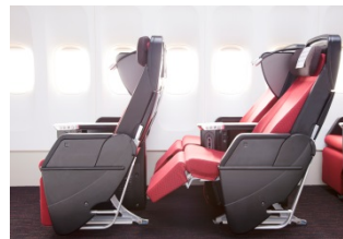
JAL SKY PREMIUM